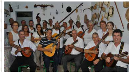
Parranda El Ratiño