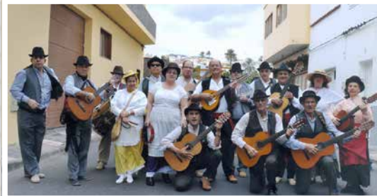
Parranda del Centro de Mayores de Ingenio